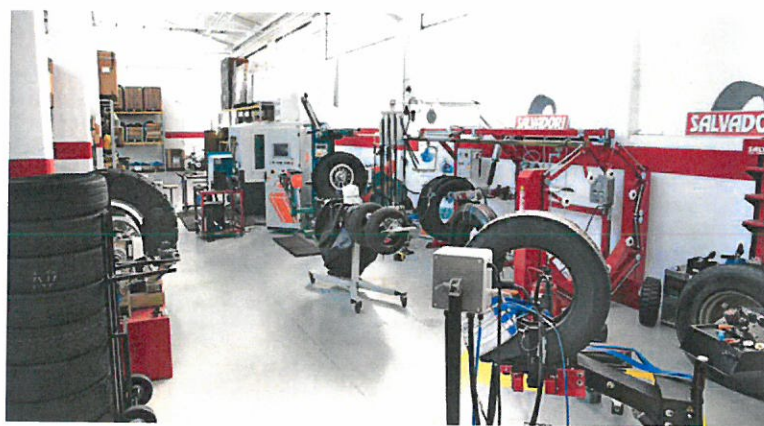
Комплекс оборудования и аксессуаров для шиномонтажа

Для горнодобывающих предприятий, а также для компаний обслуживающих горнодобывающее оборудование, конвейерные ленты и транспортные средства, Salvadori расширила линейку пневматических отбортывателей, обогатила набор сопутствующих ремонту конвейерных лент инструментов и материалов. В ближайшие годы появятся новые предложения и решения для данного сектора.