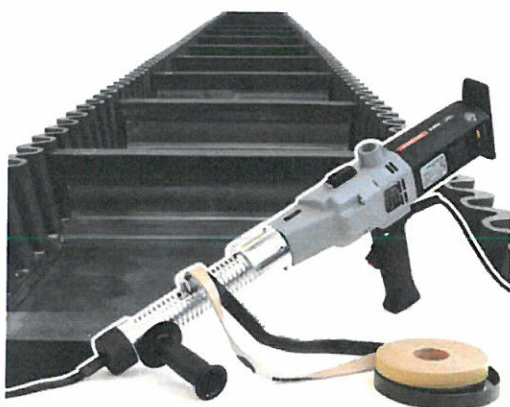
Ручной экструдер А+В для конвейерных лент