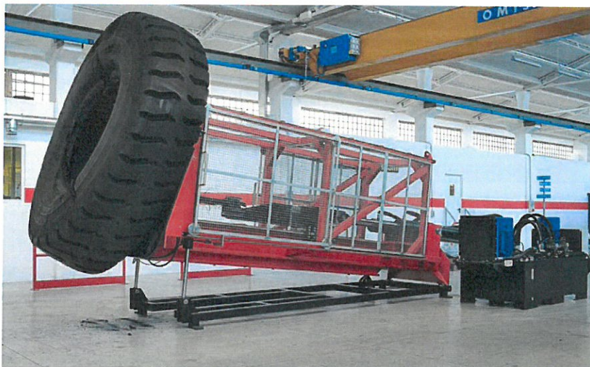
Гидравлический отбортовыватель HERCULES для КГШ диаметром 24–51 дюймов

Как отмечено выше, одним из направлений деятельности компании стали исследования и разработки новых видов оборудования для восстановления, ремонта шин, технологий и станков для их утилизации.