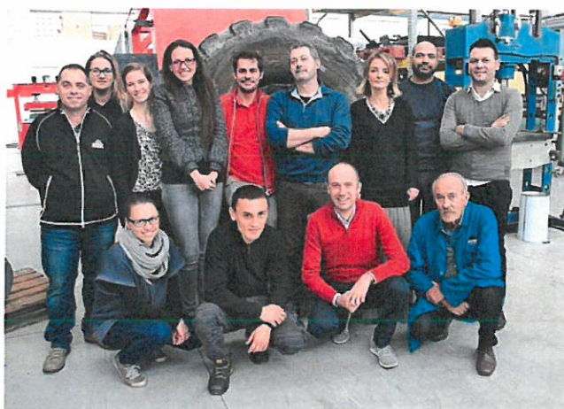
Команда компании Salvadori

Salvadori srl – семейная компания, основанная в 1983 году в городе Роверето (Италия). Основное направление деятельности компании – сопровождение автомобильных шин на протяжении их жизненного цикла: от восстановления протектора и ремонта до утилизации не подлежащих повторному использованию шин.